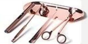
Wick Trimmer Cutter