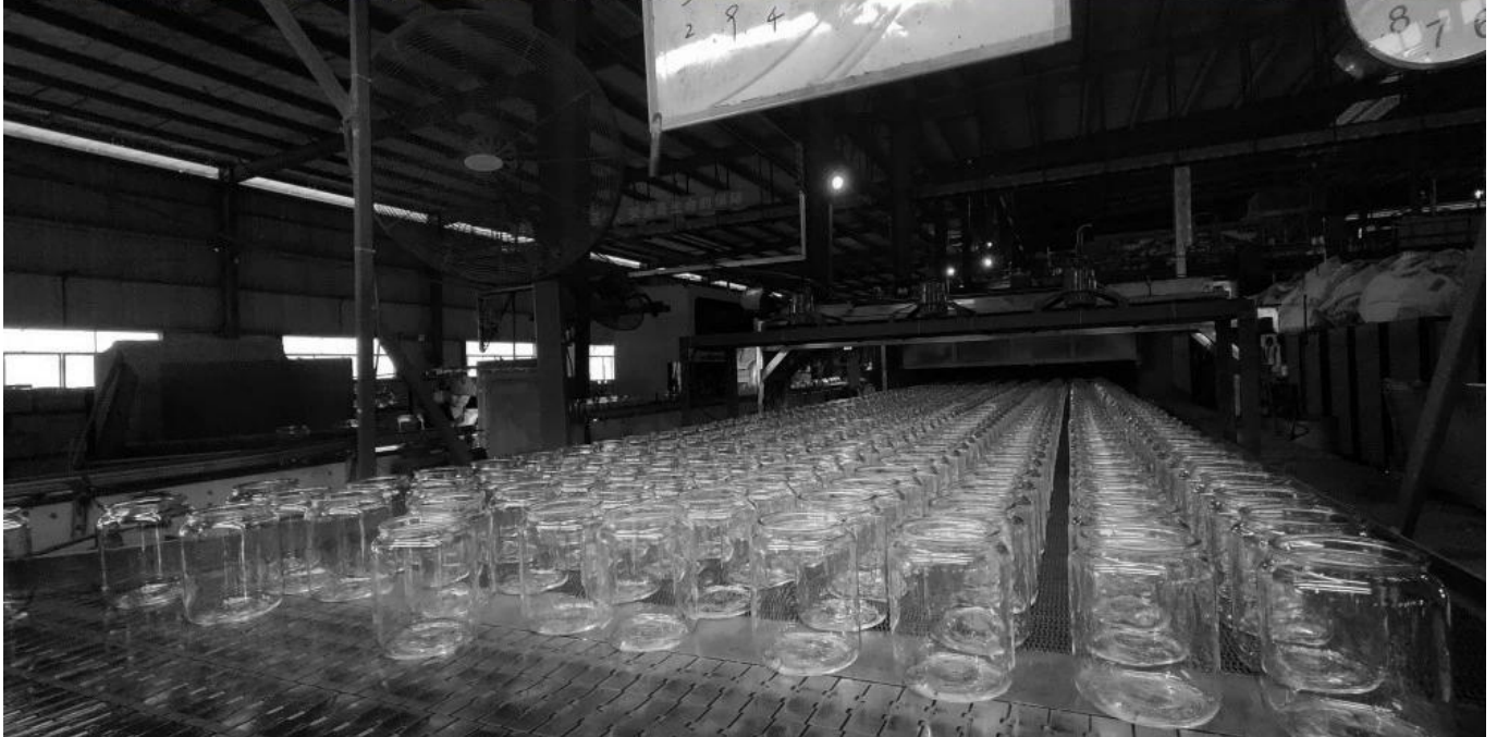
Foto de la oficina de Cupwind